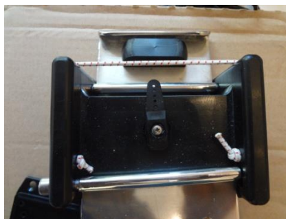
Réglage début de course